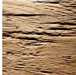
Altholz Eiche Echtholzfuernier