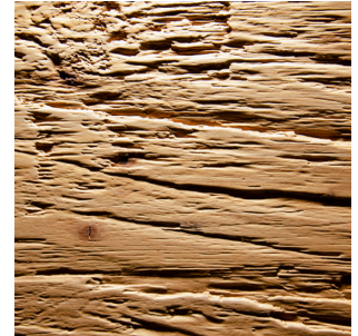
Fichte Rustico Echtholzfuernier